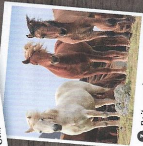
3 Reit- und Fahrverein Brake e. V.

Das Gebiet um den Obersee und die Johannisbachau ist eines der bedeutendsten Naherholungsgebiete Bielefelds. Der Obersee, die mit 15 ha größte Wasserfläche der Stadt, hat ganzjährig Saison, Wasser, Spazierwege, Gastronomie, Minigolf, Spielplätze und viele Veranstaltungen garantieren einen hohen Freizeitwert. Von den Spazierwegen um die Johannisbachau genießt man schöne Blicke über das landwirtschaftlich genutzte Tal, zum Teutoburger Wald und auf die beiden alten Hofstellen Meyer zu Jerrendorf und Wehmeyer.