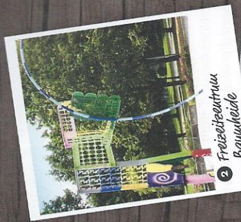
2 Freizeitzentrum Baumheide

Das Gebiet um den Obersee und die Johannisbachau ist eines der bedeutendsten Naherholungsgebiete Bielefelds. Der Obersee, die mit 15 ha größte Wasserfläche der Stadt, hat ganzjährig Saison, Wasser, Spazierwege, Gastronomie, Minigolf, Spielplätze und viele Veranstaltungen garantieren einen hohen Freizeitwert. Von den Spazierwegen um die Johannisbachau genießt man schöne Blicke über das landwirtschaftlich genutzte Tal, zum Teutoburger Wald und auf die beiden alten Hofstellen Meyer zu Jerrendorf und Wehmeyer.