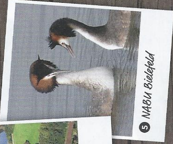
5 NABU Bielefeld