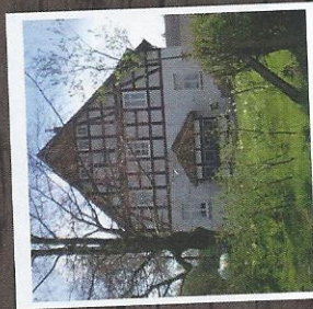
1 Halbhof mit Hof-Café