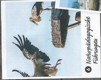
6 Naturpädagogische Führungen