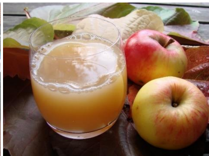
Fotos: Ernte, Versaftung und Vermarktung des Bielefelder NABU-Saftes.